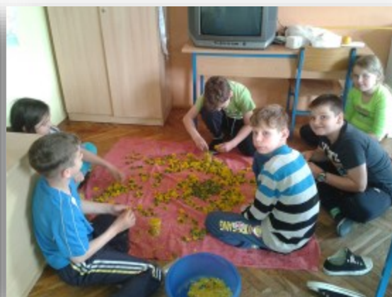
Odvajanje latica od lapova

Nakon što smo prikupili dovoljan broj cvjetova, odvojili smo latice od lapova i proučili ljekovitost maslačka. Zapisali smo recept za med koji želimo podijeliti s vama: