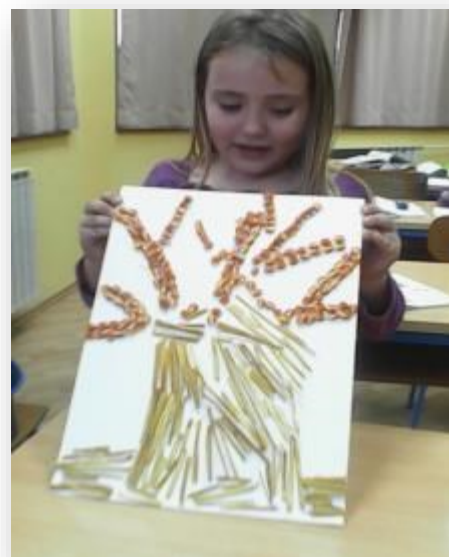
Jesen u 2.r