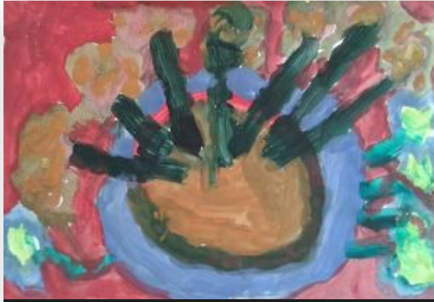
Dino Blažeković, 2. r., PŠ Drežnik, Vijenac cvijeća

Proljeće je došlo, zimsko vrijeme prošlo.