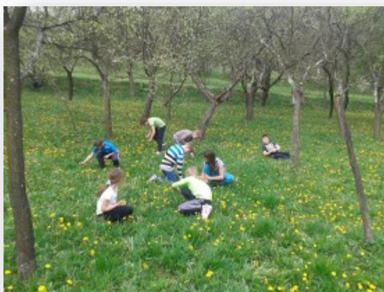
Prikupljanje cvjetova maslačka