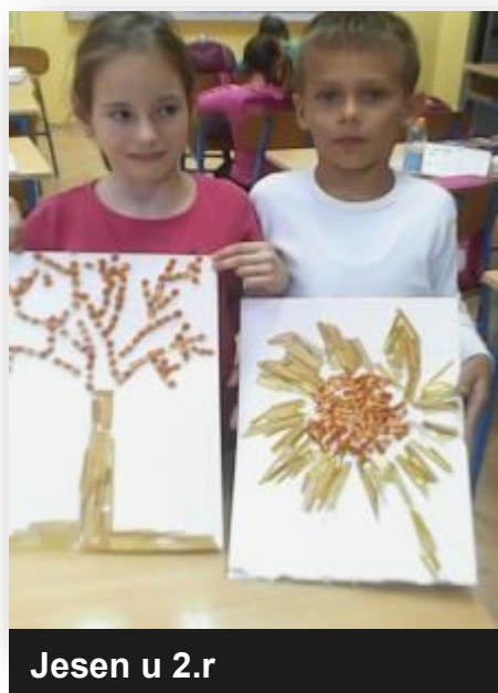
Jesen u 2.r