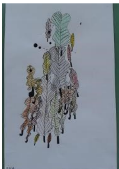
Ena Karakašić 2. r., Lišće