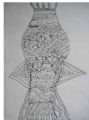
TIHANA IVANIŠEVIĆ, 6.B