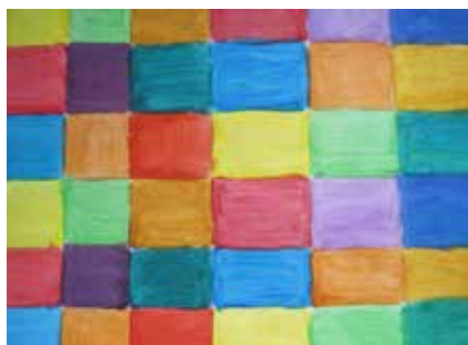
MATEA KIPŠIĆ, 5.A