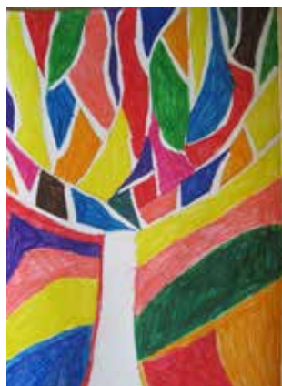
MATEA KIPŠIĆ, 5.A